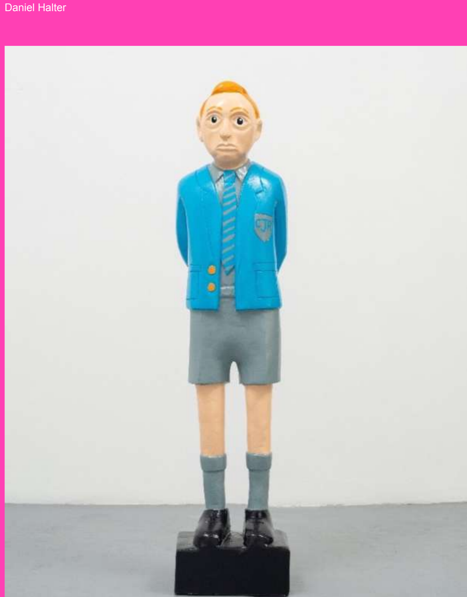
Daniel Halter, The oppressor as a child, heroin as a flower, 2019, Bois sculpté et peint par Yvan Hunter, 124 x 27 x 19,5 cm

La pratique artistique de Dan Halter s'inspire de sa situation de Zimbabween ayant été contraint de fuir un pays dont l'économie est sinistrée et le régime autoritaire ainsi que corrompu. L'artiste puise avec force dans son vécu personnel pour créer.